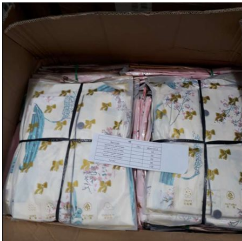
不同SKU请分别包装再装箱