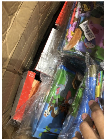
不同SKU在箱中 混合在一起