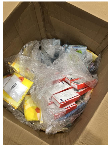
不同SKU在纸箱中 混乱排列