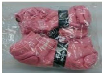
每件商品需有独立外包装