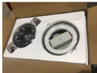
贵重/易碎商品确保保证牢固