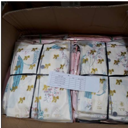
不同SKU请分别包装再装箱